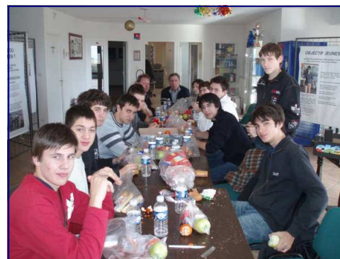
Promotion 2007-2008 en visite